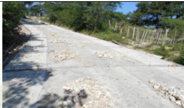
Culminación de la placa huella.

En la actualidad la obra tiene un avance ejecutado del 100%, se culminó los 300 ml de placa huella, que incluye concreto clase G, Clase C y cunetas, también se culminó el mejoramiento con material seleccionado 6 KM. Está en etapa de entrega y liquidación del contrato.